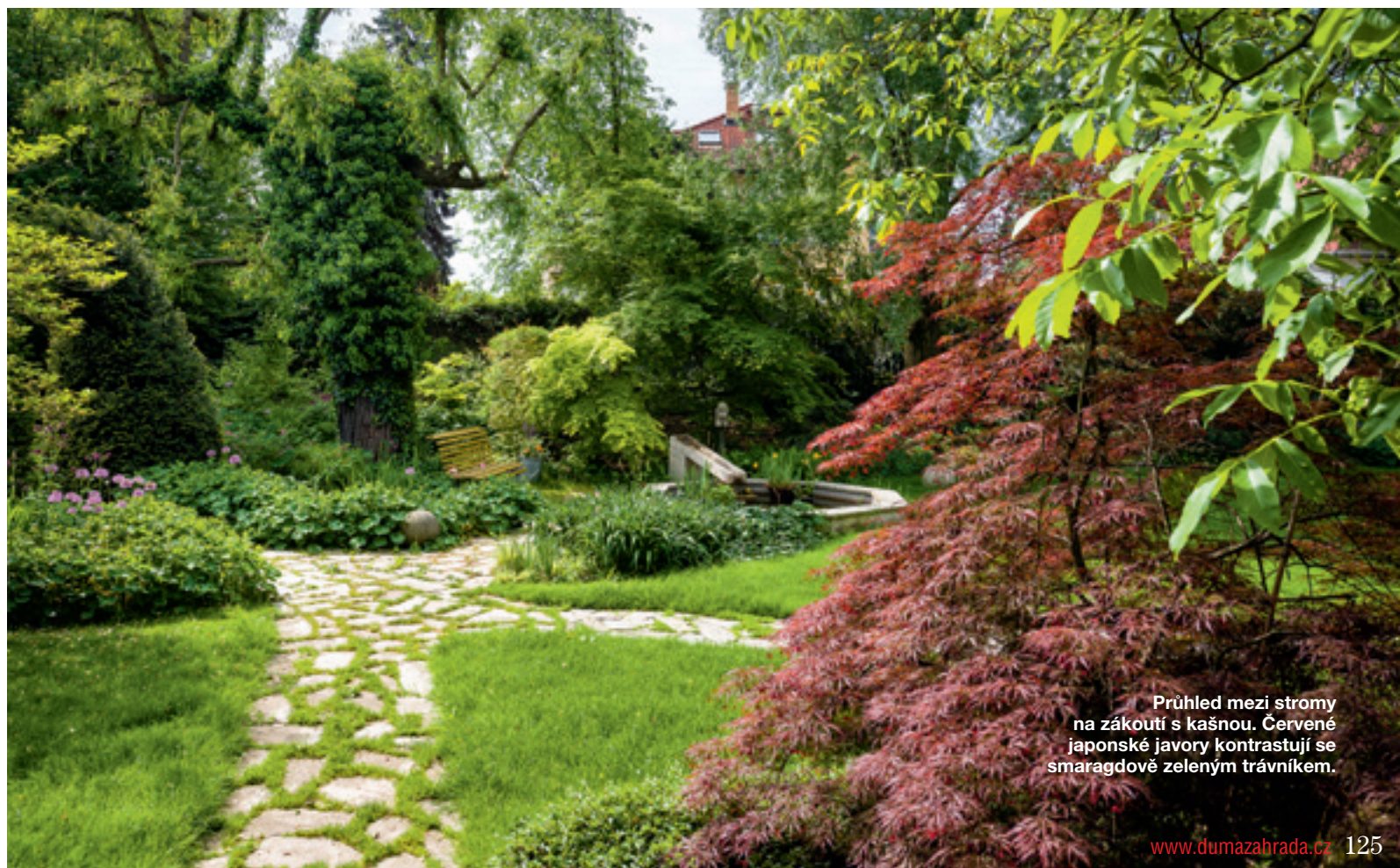
Průhled mezi stromy na zákoutí s kašnou. Červené japonské javory kontrastují se smaragdově zeleným trávníkem.

Péči o zeleň si vzala na starost manželka. Trvalo nějaký čas, než našla zahradní architektku Ing. Janu Pyškovou, se kterou si padly do noty. Ta navrhla zásadní remodelaci plochého terénu, která nové zahradě dodala zajímavost, atmosféru a trochu potřebné tajuplnosti. Další důležitý krok bylo založení zvlněných kamenných cestiček. Meandrováním vzniká optický klam, že zahrada je delší než ve skutečnosti. Umožňuje, aby se při procházce před námi postupně otvíraly průhledy do jednotlivých částí a promyšleně vytvořených zákoutí.