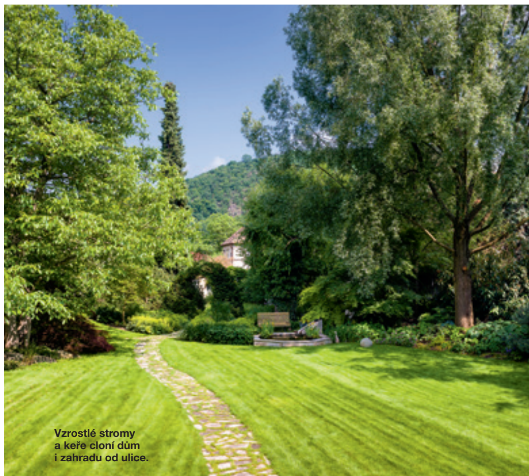
Vzrostlé stromy a keře cloní dům i zahradu od ulice.

M anželé kupovali pozemek porostlý džunglí, přes kterou nebylo vidět zchátralou vilu, kterou původně měli v plánu rekonstruovat. „Nakonec jsme dali za pravdu architektovi, který ji doporučoval zbourat a postavit v zadní části parcely moderní dům. Když byl rozestavěný, zaměřili jsme se na zahradu. Protože ta původní byla nezajímavá a spíš užitková, nebylo co pietně rekonstruovat, ale bylo zapotřebí vytvořit zahradu úplně novou.“