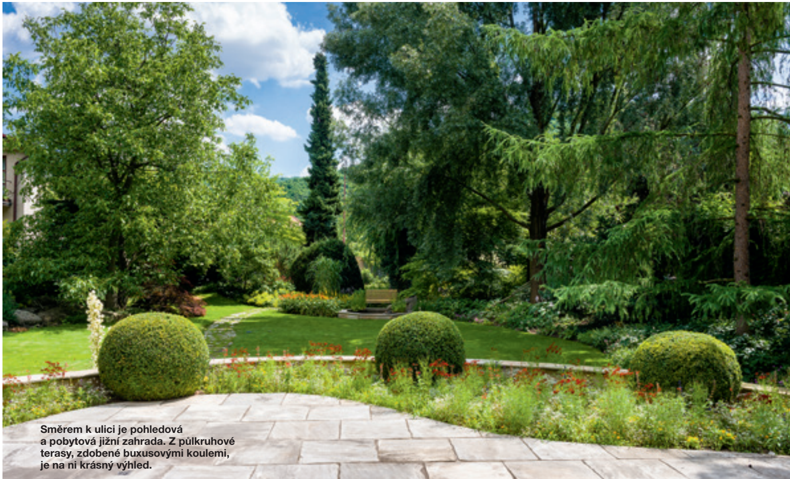
Směrem k ulici je pohledová a pobytová jižní zahrada. Z půlkruhové terasy, zdobené buxusovými koulemi, je na ni krásný výhled.

Dnes se z proskleného přízemí vily vstupuje na půlkruhovou terasu, která je zhruba 70 centimetrů nad úrovní přední části zahrady orientované na jih. Modelací se vytvořila prohlubeň ke krytému bazénu a vytvarovalo návrší podél severního a jižního plotu. Veškerá pohledová a pobytová zahrada je v přední části pozemku, směrem k ulici. Za domem je menší užitková zahrada s bylinkami a zeleninou.